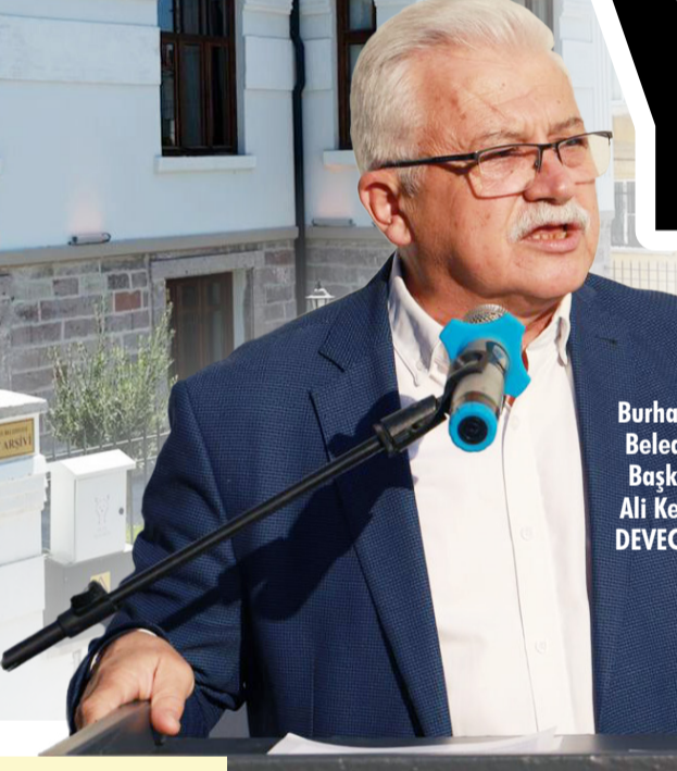
Burhaniye Belediye Başkanı Ali Kemal DEVECİLER

Burhaniye Belediyesi tarafından ilçenin tarihi ve kültürel mirasını koruma amacıyla hayata geçirilen Kent Arşivi , 6. Burhaniye Kitap Fuarı kapsamında düzenlenen açılış töreniyle hizmete açıldı.