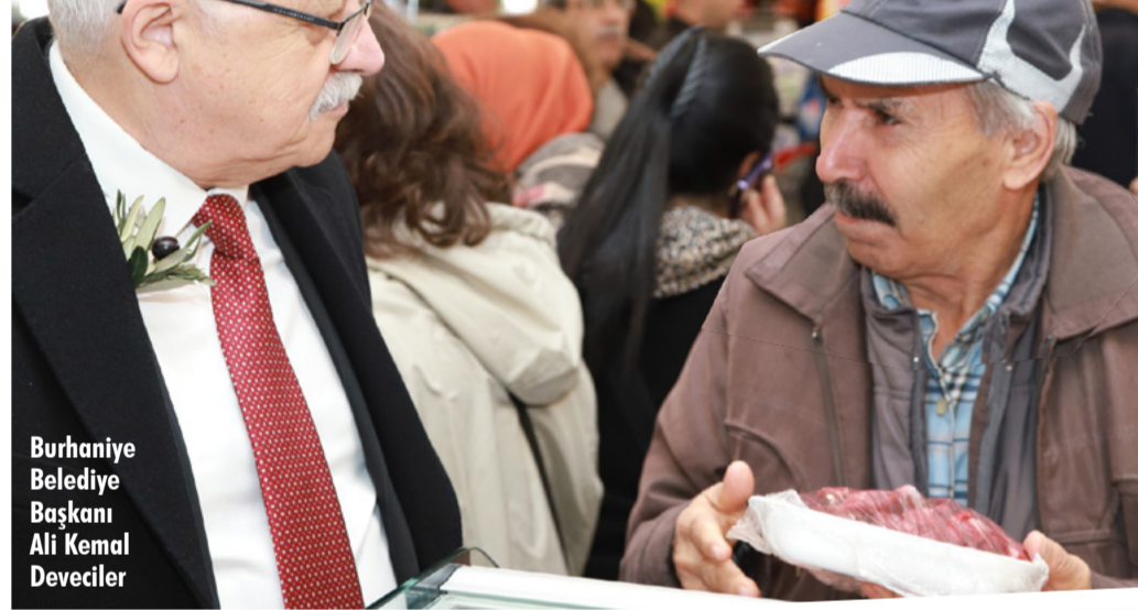
Burhaniye Belediye Başkanı Ali Kemal Deveciler

Bu yıl 20.'si düzenlenen Burhaniye Zeytin ve Zeytinyağı Hasat Festivali programında, Burhaniye ve bölgedeki bir ilke imza atılarak "Halk Market" projesi halkın hizmetine sunuldu.