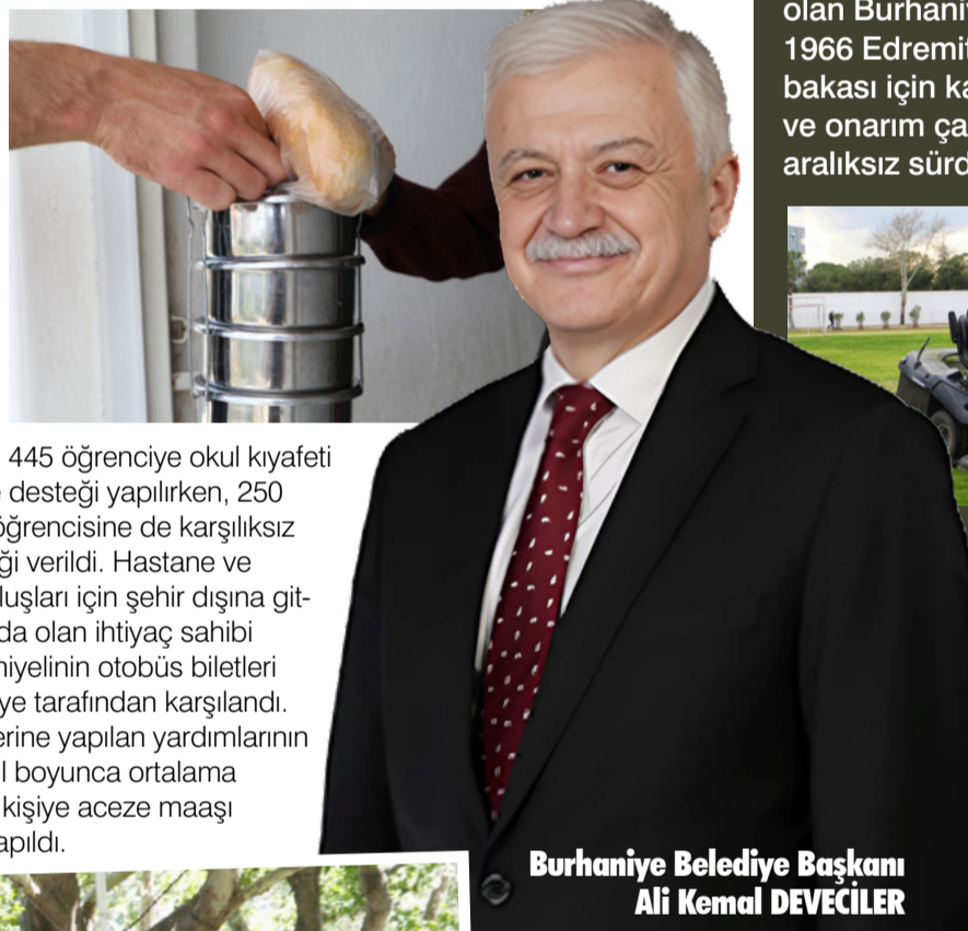
Burhaniye Belediye Başkanı Ali Kemal DEVECİLER