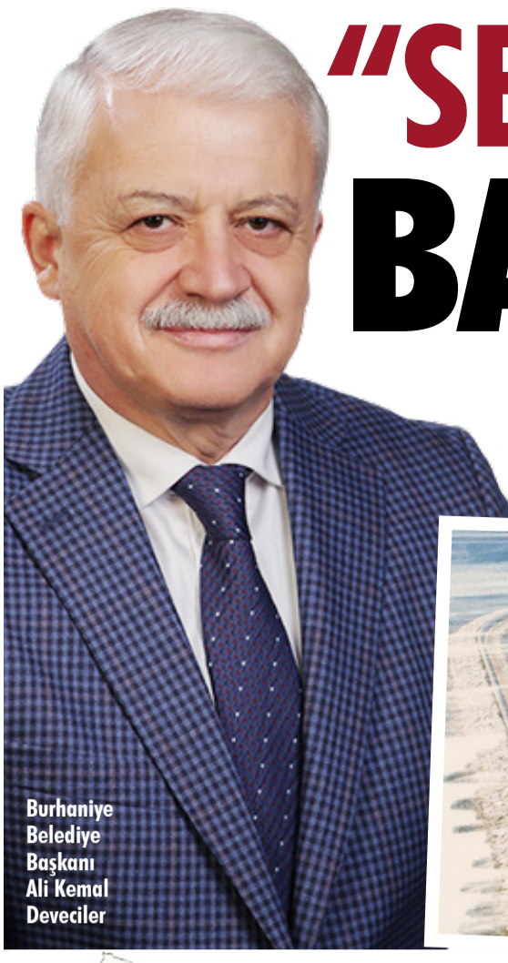
Burhaniye Belediye Başkanı Ali Kemal Deveciler