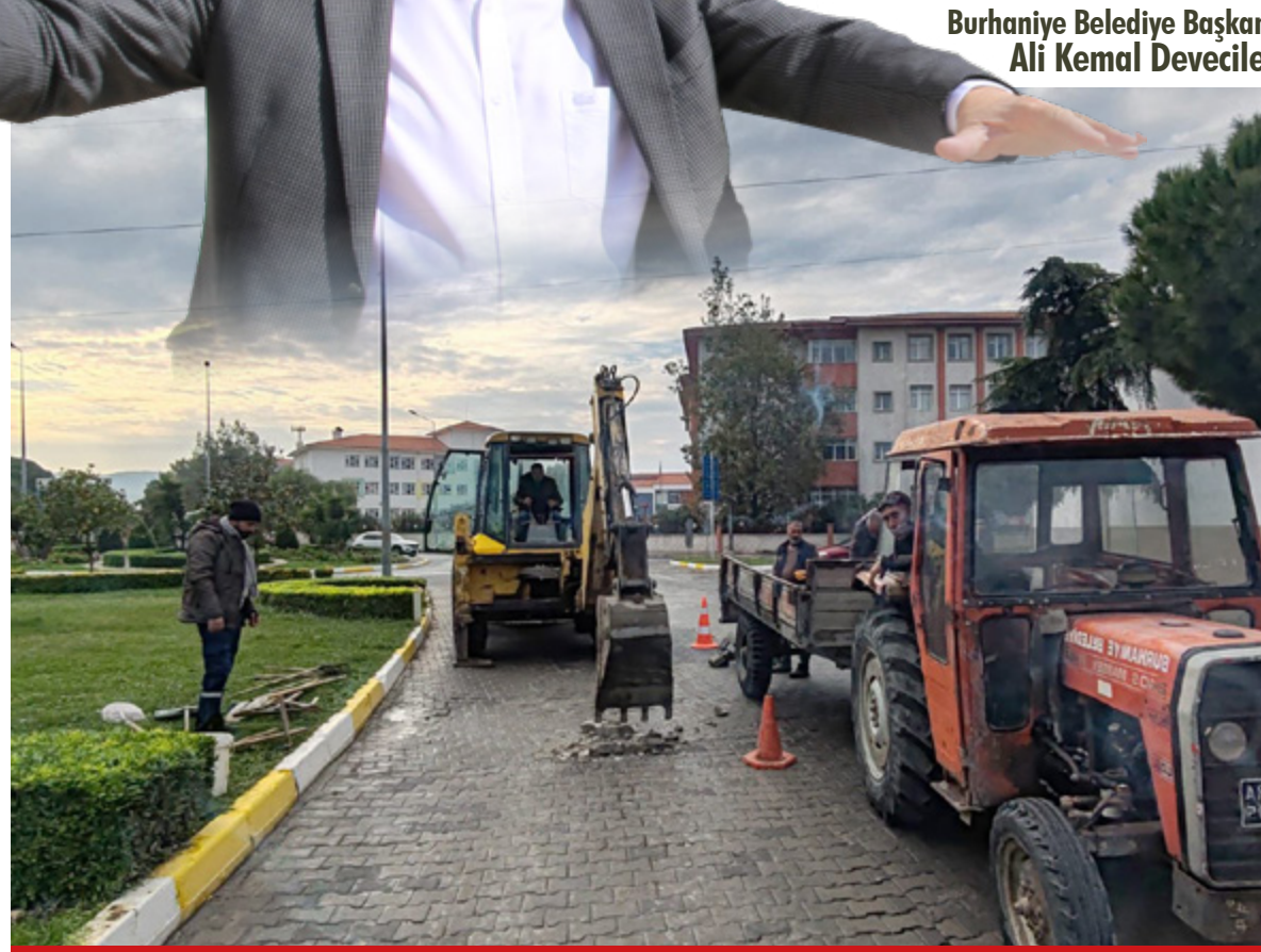
Burhaniye Belediye Başkanı Ali Kemal Deveciler

Belirlenen program kapsamında; Bahadınlı Kırsal Mahallesi, Cumhuriyet Mahallesi 61. Cadde, 36. ve 43. Sokak, Cahit Sıtkı Tarancı Caddesi, Öğretmenler Mahallesi Muammer Aksoy Caddesi, İskele Mahallesi Ayhan Özerdem Caddesi, Mahkeme Mahallesi Saip Hoca Bulvarı ve Kocacami Mahallesi Kuyu Sokak'ta parke taş tamiratları, Hacıahmet Mahallesi Kavakdibi Caddesi'nde kozak taşı tamirleri, Bahçelievler Mahallesi Enver Gürel Caddesi'nde yağmur suyu mazgallarının açılması, Melih Pabuçcuoğlu Bulvarı'nda bordür boyanması ve Bahçelievler Mahallesi 2770. Cadde'de kası onarım çalışmaları gerçekleştirildi.