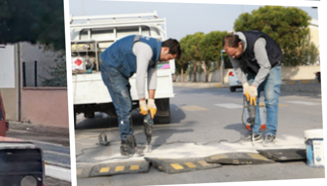
Burhaniye Belediyesi Fen İşleri Müdürlüğü ekipleri, planlanan program dahilinde çalışmalarını aralıksız sürdürüyor.

Burhaniye Belediye Başkanı Ali Kemal Deveciler konuyla ilgili yaptığı açıklamada, "Altyapımızı güçlendirmek, vatandaşlarımızın günlük yaşamını kolaylaştırmak ve Burhaniye'mizi daha modern bir hale getirmek için ekiplerimiz yoğun bir tempoyla çalışıyor. Kırsal ve merkez mahalleler olmak üzere ihtiyaç duyulan tüm bakım ve onarım çalışmalarımızı hızla tamamlayarak ilçemizi güzelleştirmeye devam edeceğiz" dedi.