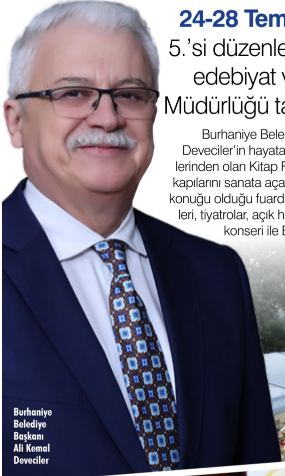
Burhaniye Belediye Başkanı Ali Kemal Deveciler