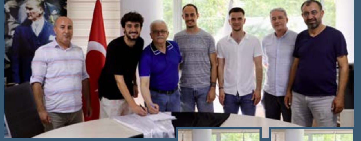
2023-2024 transfer sezonunun başlamasıyla birlikte iç transfere yoğunlaşan siyah beyazlı ekip, takımın çeşitli bölgelelerinde görev alan 5 önemli oyuncusuyla nikah tazeledi.

Bölgesel Amatör Lig'de mücadele eden Burhaniye Belediyespor, geçtiğimiz sezon takımın önemli isimleriyle sözleşme yenileyerek güçlü bir kadro oluşturma yolunda tam gaz ilerliyor.