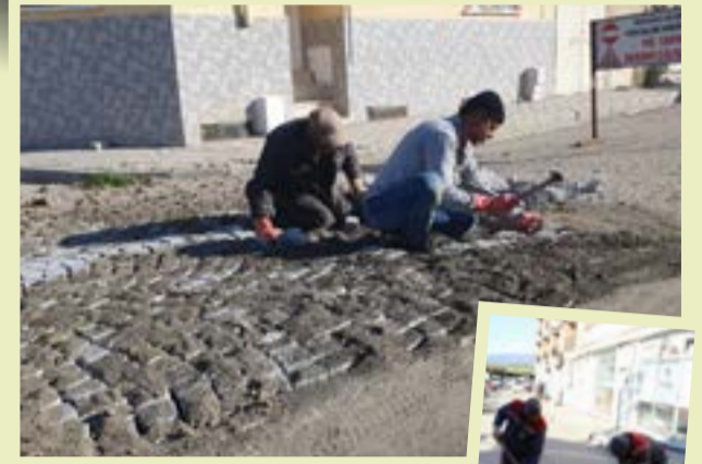
Kırsal Avınduk Mahallesi'ne bağlı yolların genişletme ve düzeltme işlerini yapan ekipler, çevre yolların da çalışmalarına devam ediyor.