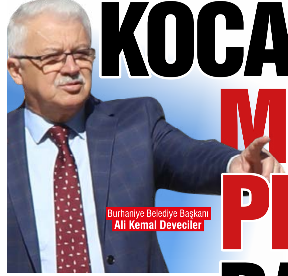
Burhaniye Belediye Başkanı Ali Kemal Deveciler

Belediye Başkanı Ali Kemal Deveciler, "Yaklaşık 50 gün sürmesi planlanan Kocacami Meydan Projesi tamamlandığında bölgenin vizyonu artacak"